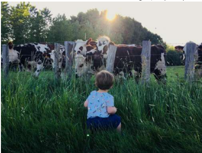
Prix "Autrement Vu" du public FIGRA, France, 2019

Prix de la Faculté d'Agrobiologie, de l'Alimentation et des Ressources Naturelles au Life Sciences Film Festival de Prague, République Tchèque, 2018.